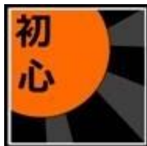
Judovereniging Sho shin

Vanuit de samenwerking met Actief Maas en Waal organiseren we dit i.s.m. judovereniging Tora uit Boven-Leeuwen. Deze bijzonder leuke workshop is er voor de kinderen van de groepen 1 t/m 4 . Als een échte judoka, op een échte judomat, in een écht judo pak gaan de leerlingen kennis maken met de judosport.